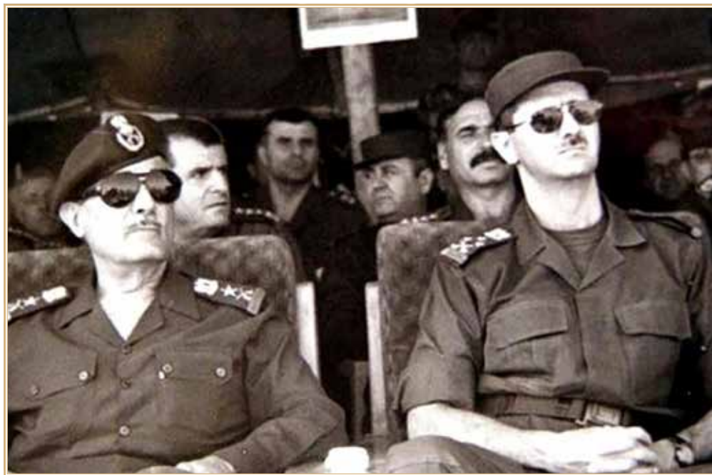
Хафез (слева) и Башар Асады

На съезде также было принято решение о развитии социально ориентированной рыночной экономики и финансово-банковской отрасли. В то же время, как подтверждал исторический опыт развития капитализма, система свободного рынка наряду с определенным макроэкономическим эффектом провоцирует рост безработицы, инфляцию, расслоение общества, увеличение числа неимущих и усиление социальной напряженности. Данные процессы в определенной мере имели место в Сирии.