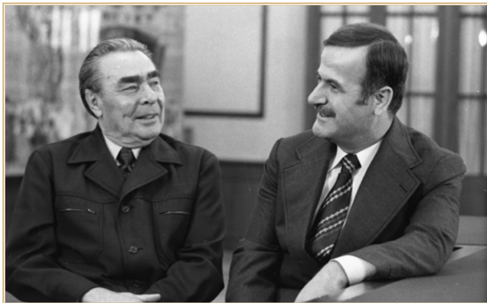
Хафез Асад и Л.И. Брежнев

ческих комплексов, прокладке железных дорог, разработке природных ресурсов страны, укреплении обороноспособности сирийской армии. На основе военно-технического сотрудничества создавались советская военно-морская база в районе Латакии — Баниаса и военный аэродром для дальней авиации. Расширялась координация работы спецслужб двух стран по противостоянию действиям враждебных акторов 17 . Сирийский космонавт принимал участие в научных исследованиях, совершая полет на советской космической станции. Тысячи сирийских студентов обучались в вузах СССР. Причем многие из них создавали смешанные семьи, дети которых говорили по-русски и по-арабски и становились носителями двух культур, укрепляя гуманитарные связи двух стран. При этом в Дамаске сформировался целый район, в котором проживали такие смешанные семьи, который назывался «русским». Во время неоднократных деловых и научных командировок в Сирию автору этих строк довелось посещать его и общаться с представителями таких семей и выпускниками советских и российских вузов.