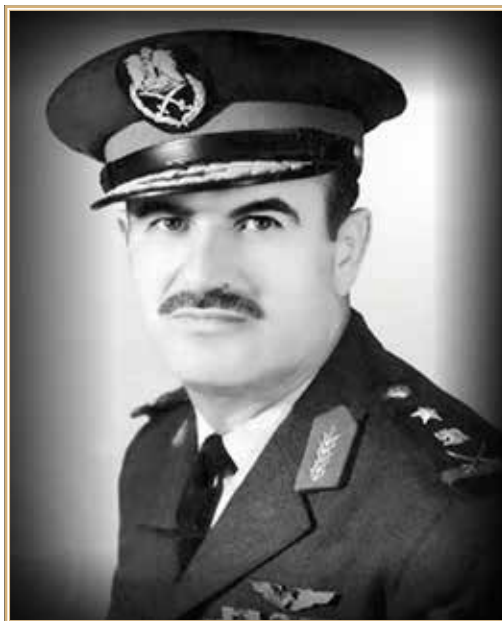
Хафез Асад

пришедшая к власти в 1963 г. ПАСВ, выступавшая за арабское единство и построение «арабского социализма», выдвигала свою доктрину на основе идей панарабизма, элементов социалистической концепции и ислама. Это обеспечило реализацию в Сирии программы социально-экономических и политических преобразований в соответствии с идеологией ПАСВ.