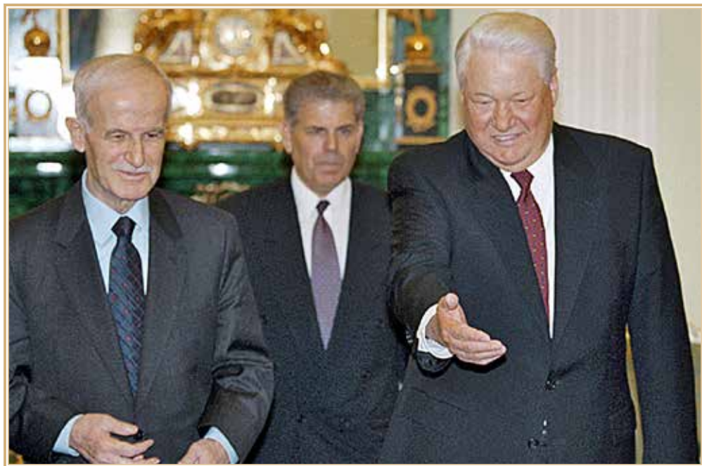
Хафез Асад и Б.Н. Ельцин

или семейные контакты с СССР — врачей, преподавателей, научных работников и предпринимателей 20 . В 1982 г. «Братья-мусульмане» организовали в г. Хама вооруженный мятеж 21 , который видный российский ученый-востоковед Р.Г. Ланда характеризовал как «опасную вспышку клерикального обскурантизма и экстремизма. Наряду со взрывами и покушениями, провоцированием противостояния на кон-